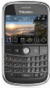
Geoscape Black Berry